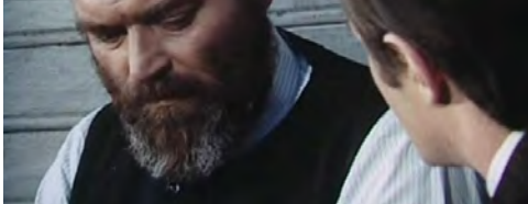
ÎN PREZENTA LUI NICOLAE BREBAN