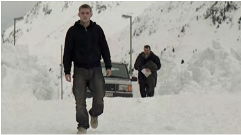
CU O INTRODUCERE DE THIERRY FRÉMAUX

Un garçon fragile. Le projet Frankenstein