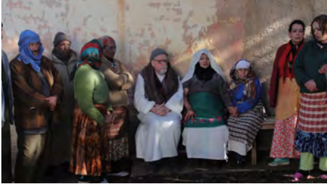
CU O INTRODUCERE DE THIERRY FRÉMAUX