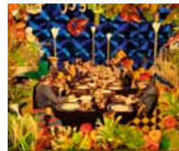
Who Cares About the Real