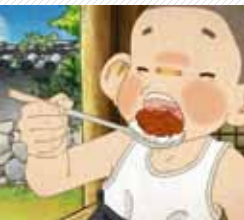
Eat Eat Eat / Bab Mook Ja