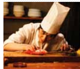
The Perfect Red Snapper Fish

Regia / Directed by: Prachaya Lampongchat