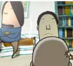
An Artistic Presentation of Metaphysical Butterfly Effect